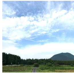
トロが出てきそうな木のトンネルがとても気に入っています(*▽*)

遊びがてらちびっこ達と一緒にいったときは、ブルーベリーを収穫してカゴに入れるそばからカゴの中身が消えていきます。なんとまか不思議なこともあるものですね♪